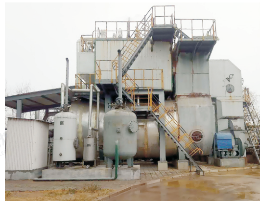
2016.12-8吨 CDZL5.6-85/70-T 河南新郑郑新中原乾通（新密）煤业有限公司