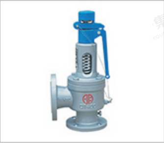
郑州明宇球墨铸铁弹簧全启式安全阀