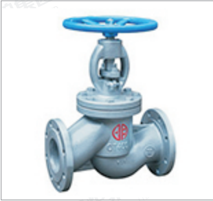
郑州宇明球墨铸铁截止阀