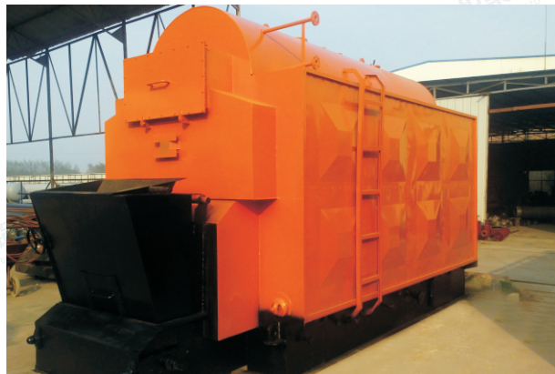
2014.10-6吨 CDZL4.2-85/70-T 湖北咸宁赤壁市志强服饰有限公司