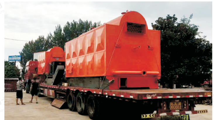
2016.12-6吨 DZL4.2-1.0/115/70-T 河南周口河南盛鸿纺织有限公司