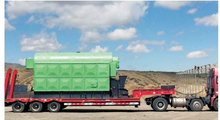
2016.12-3吨 DZL2.1-1.0/95/70-T 内蒙古通辽市威士大酒店有限责任公司