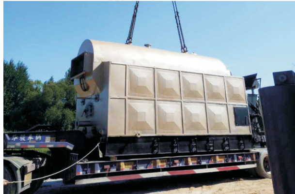
2015.6-6吨 DZL6-1.25-T 江西宜春江西倍肯药业