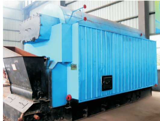
2017.4-4吨 DZL2.8-1.0/115/70-T 江西南昌江西美依洁洗涤厂